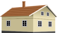
就労継続支援事業所等